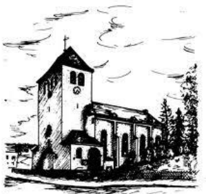
St. Antonius Einsiedler-Kirche Gerlingen

Das Team der Kinder freuen sich auf schöne gemeinsame Stunden bei Kaffee und Kuchen. Gegen 16:00 Uhr können sich alle auf eine musikalische Darbietung des Kinderchors Vocalinis freuen. Es grüßt herzlich das Team des Kinder- und Jugendvereins JUKIDS Ottfingen