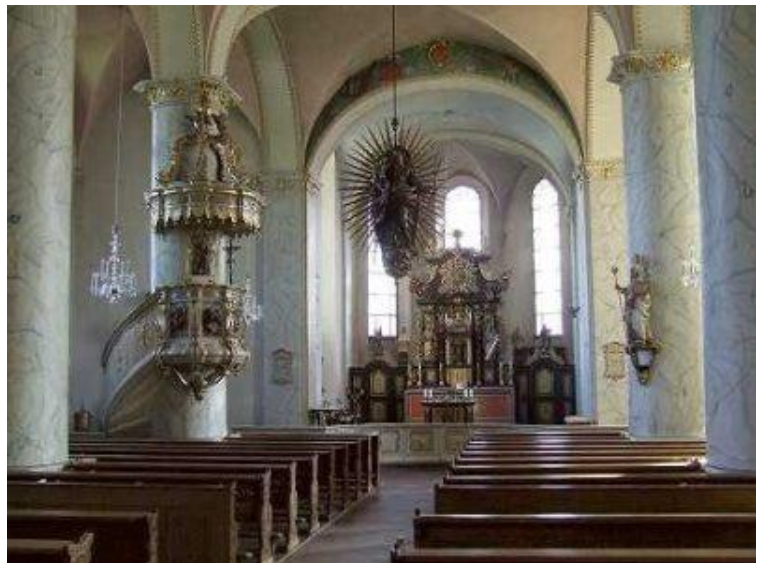
Kirche St. Severinus Wenden

Mit von der Partie sind neben dem Projektchor auch Solisten, die Musiker des MAKSi-Akademieorchesters aus Siegen, der Musikzug Iseringhausen und die Chorgemeinschaft Kreuztal 1851 e.V. Der Eintritt ist frei.