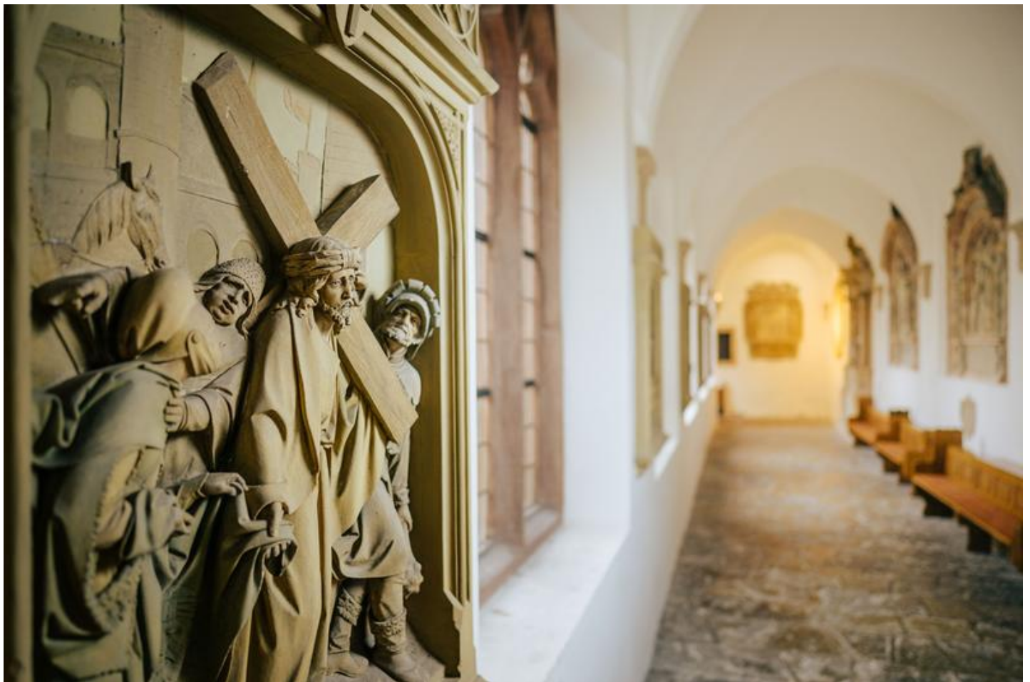
Kreuzgang Paderborner Dom