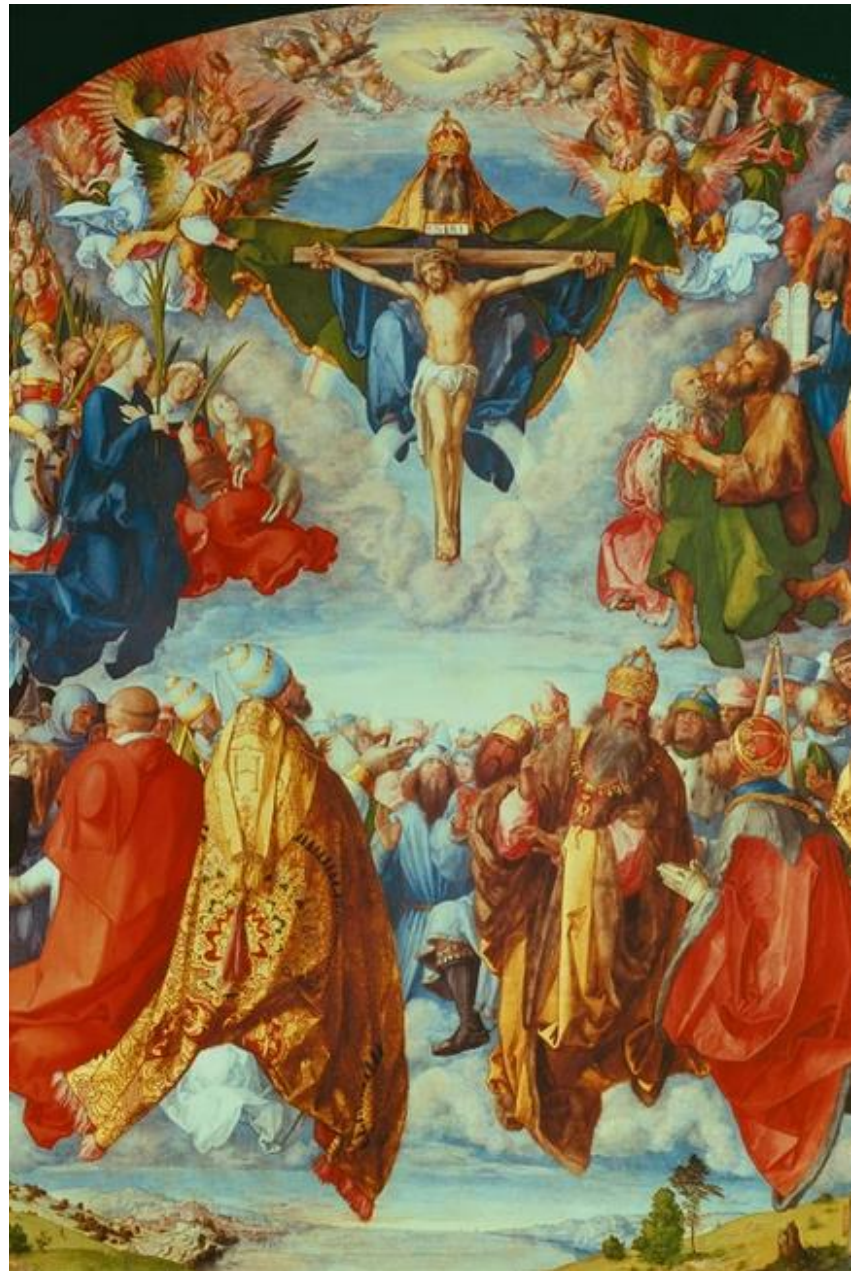
Albrecht Dürer: Allerheiligenbild

So, liebe Schwestern und Brüder, bekennen wir es in der Messfeier. Zwei Wochen im Jahr sind es, die uns wie keine andere Zeit den Zusammenhang von Leben und Tod und Tod und Auferstehung vor Augen stellen: Die Kar- und Ostertage, sowie die nun vor uns liegenden Tage von Allerheiligen und Allerseelen. Der Ritus der Beerdigung in seiner Vollform stellt diesen Zusammenhang anschaulich dar. Da auch unser Wendener Land vom Wandel der Bestattungskultur und der schwindenden kirchlichen Praxis nicht verschont bleibt, darf ich anlässlich von Allerheiligen/Allerseelen den Hintergrund des Beerdigungsritus in Erinnerung rufen: